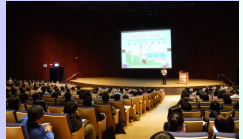
▲ 3 月 7 日最有利標採購評選作業實務暨錯誤態樣預防講習(第 2 場次) 情形

助各機關正確辦理最有利標，本府採購稽核小組特邀請行政院公共工程委員會企劃處陳尤佳處長及本府採購稽核小組外聘委員陳有政主任擔任講座，於 107 年 1 月 31 日及 3 月 7 日針對採購評選作業召集人及工作小組辦理講習，促使承辦採購相關人員嫻熟最有利標法令、制度、權責與重點注意事項，有效確保採購效率與品質。