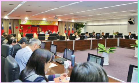
▲本府 107 年第 1 次廉政會報召開會議情形

展中心」、地政局「市地重劃工程-第十四期第六工區公園景觀標(含 14 期全區公園簡易綠美化)工程」及都市發展局「智慧營運中心新建工程」，並積極規劃設置行政透明措施，將相關採購資訊公開，以結合民眾監督力量，達成營造優質採購環境及提升市政建設品質的目標。