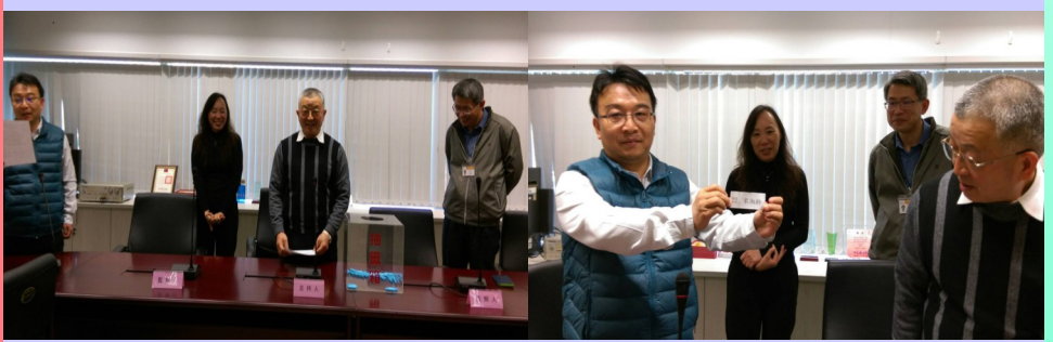
▲ 2 月 12 日本府政風處 106 年度公職人員財產申報實質審查暨前後年度比對公開抽籤作業辦理情形