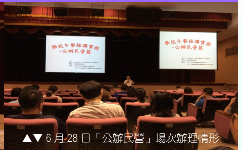
▲▲ 6月28日「公辦民營」場次辦理情形

為了使本府學校同仁能以廉潔的意識，精進學校午餐採購品質，提供給莘莘學子們安全健康的用餐環境，本府政風處特別偕同教育局辦理「臺中市政府「廉潔安心·食在放心」學校午餐專案宣導活動」。