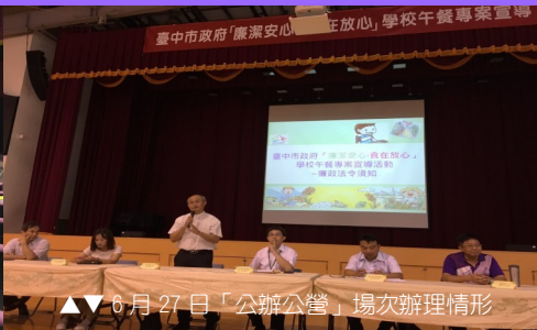
▲▲ 6月27日「公辦公營」場次辦理情形