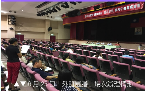
▲▲ 6月25日「外訂團膳」場次辦理情形