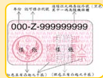
圖示：爆竹煙火認可標示 Illustration: Firecrackers and Fireworks Identification Sign

Fire Bureau is here to appeal every citizen, it needs more certain information to blow the whistle on illegal firecrackers and fireworks manufacturing, deposit, vending sites or people and vehicles to come in and go out on the lurk, you are welcomed to report the situation to the Fire Bureau (you can directly dial 119) and assert public safety in company with us. Furthermore, any verified report will be awarded reporting bonus