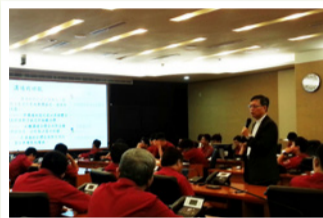
圖二 溝通的四大功能