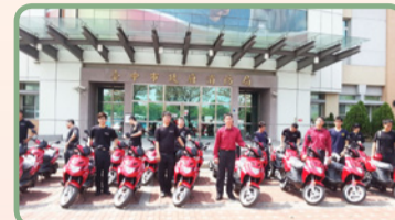
專責檢查小組派員領車情形