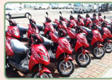
消防安檢公務機車20輛