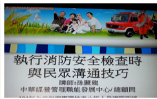
圖一 溝通技巧講習訓練