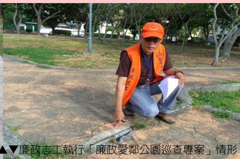
▲▼廉政志工執行「廉政愛鄰公園巡查專案」情形