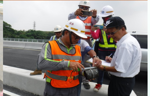
本府道路工程查驗小組 107 年第 2 季查驗情形

路平計畫為本府重大施政計畫，本府政風處擔任本府道路工程查驗小組秘書單位，為提升道路工程品質，力求「路平」與「廉能」兼具，落實「精準選案 執行落實 後續貫徹」行動策略，透過縝密系統化作為勾稽風險道路工程，積極辦理道路查驗並全程掌握查驗程序，確實追蹤缺失改善及落實嚴重缺失實地複核。