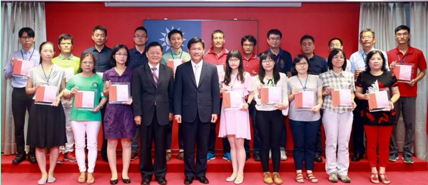
▲市長林佳龍及政風處處長張榮貴與廉潔楷模受獎者合影

為提升廉潔效能、勉勵同仁崇法務實，市長林佳龍於 107 年 9 月 17 日市政會議親自頒獎表揚 20 位「廉潔楷模」，藉由表彰優良廉能事蹟，期能收激濁揚清之效並深化基層廉能公務倫理。