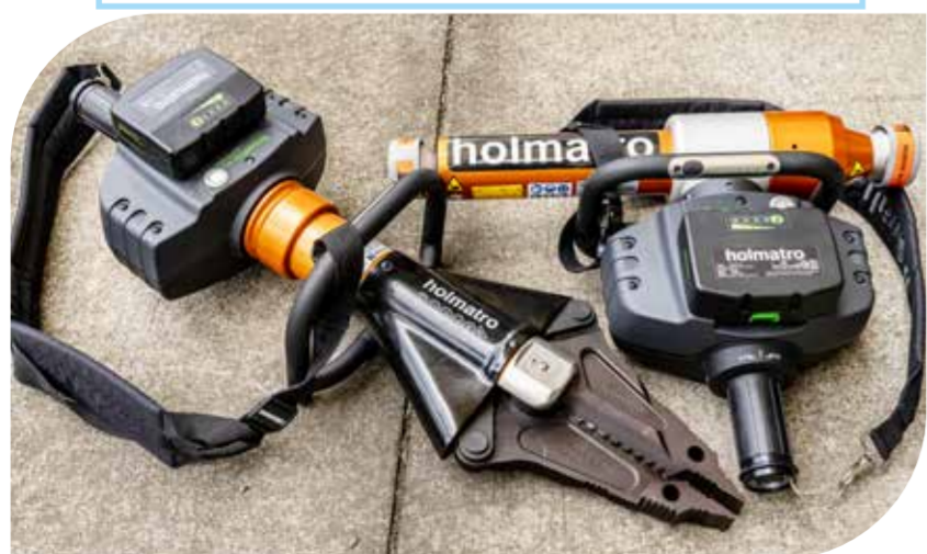
電動三合一油壓剪 (左) 電動推頂桿 (右)

電動三合一油壓剪具有撐開、拉動、剪斷等功能，於車禍救援車體破壞或破門勤務使用；電動推頂桿於車體潰縮時將車體結構推頂適當空間以利救援。