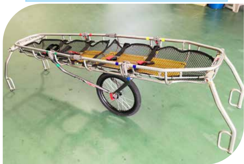
籃式擔架附輕型推輪 (獨輪擔架)

鈦合金材質，擔架底部以軟網鋪設包覆，使傷病患躺臥時較舒適，輕量化金屬材質手把及薄型單輪，可供山難搜救人員載運傷患時推行。