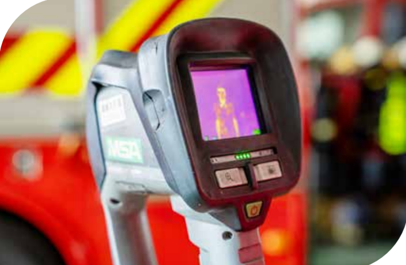
章芷綺 彭玉芳 李怡凡 李怡平 攝於 水滸分隊