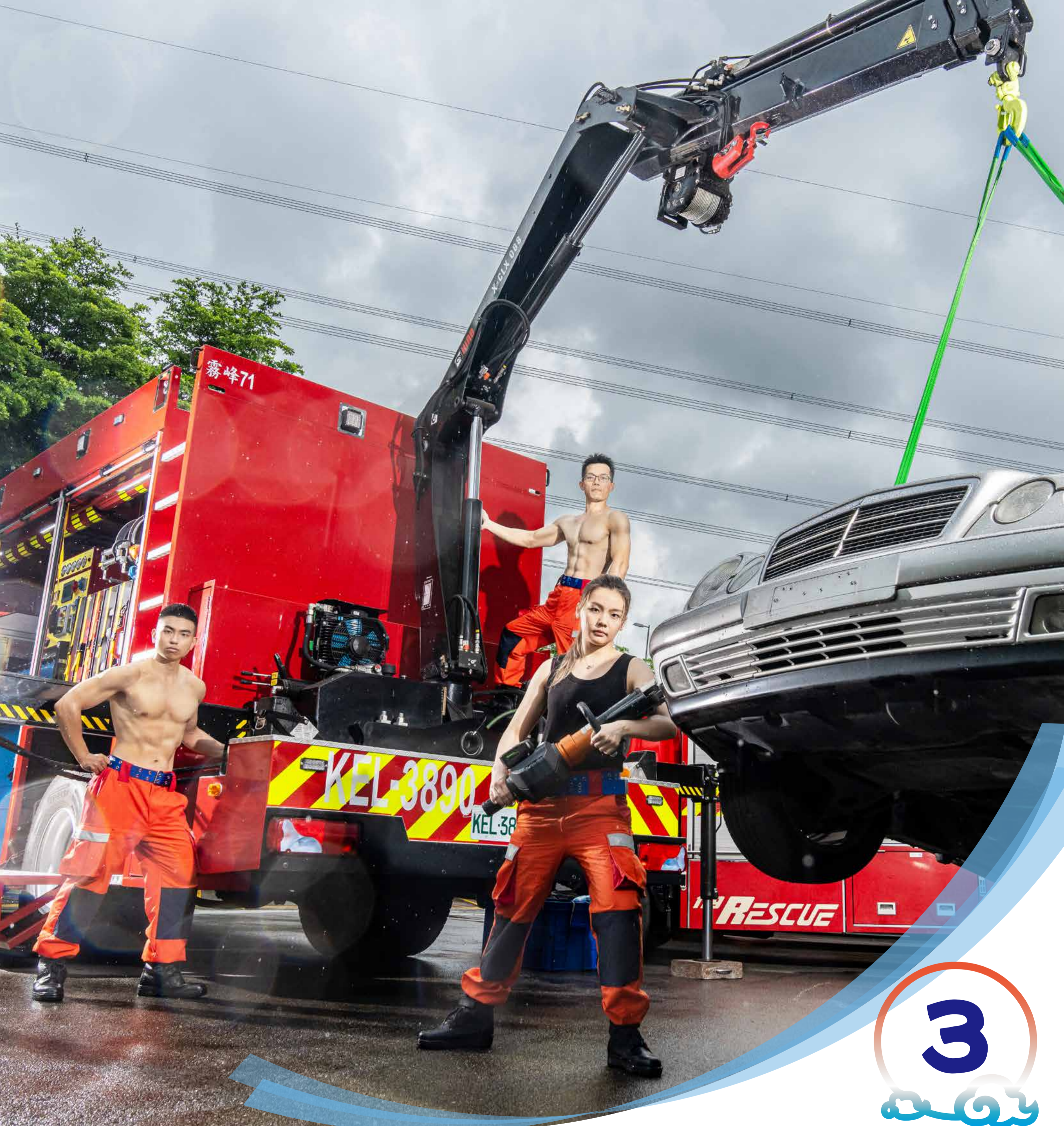
吳遵憲 彭玉芳 沈治宇 攝於 溪瀾分隊