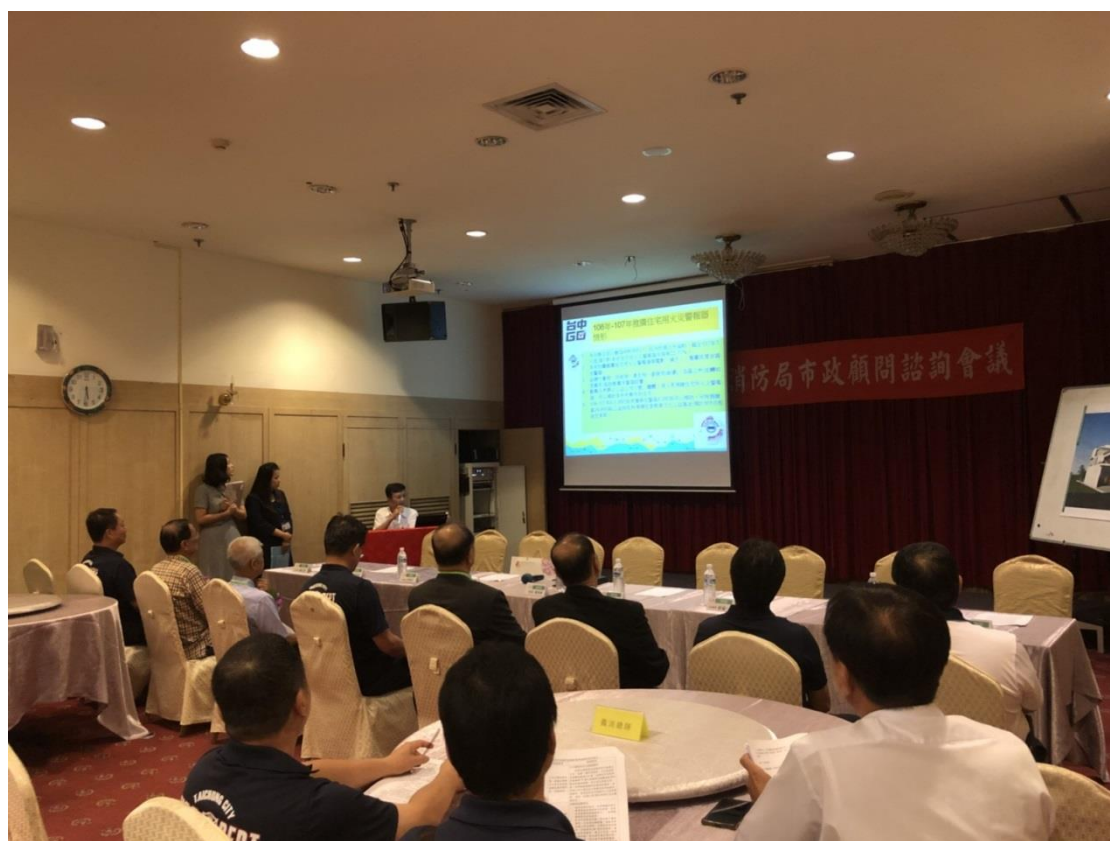
▲楊主任秘書說明本局 106 年施政成效及 107 年施政展望