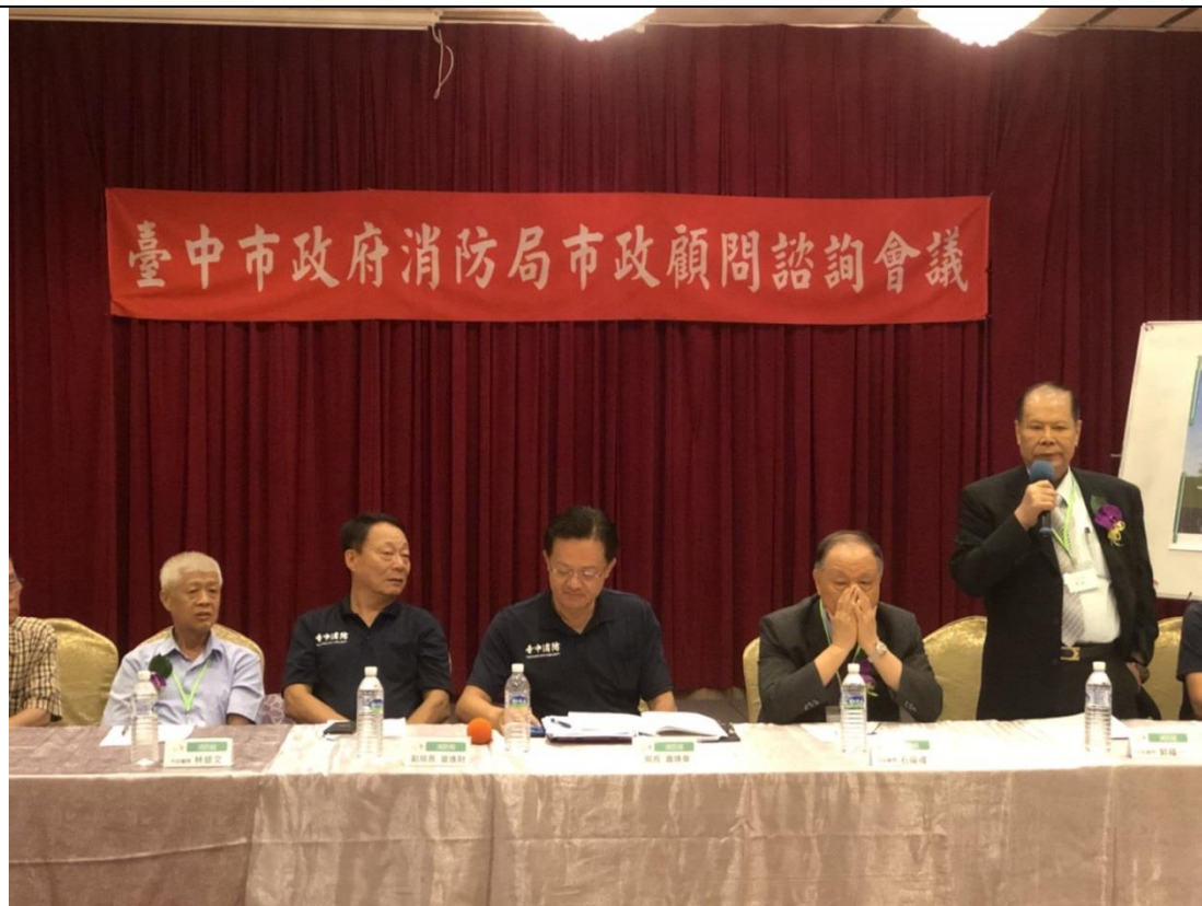
▲郭市政顧問福一致詞